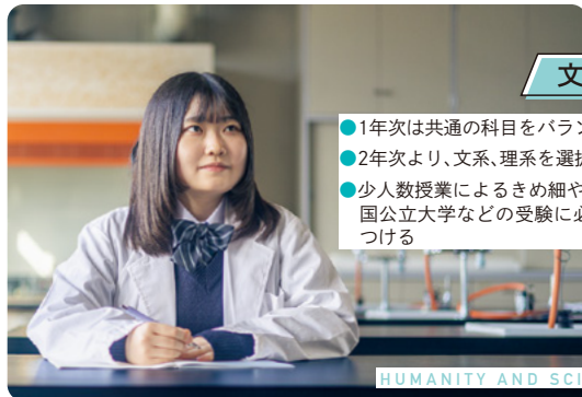
HUMANITY AND SCIENCE COURSE