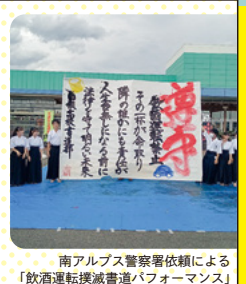
南アルプス警察署依頼による「飲酒運転撲滅推進パフォーマンス」