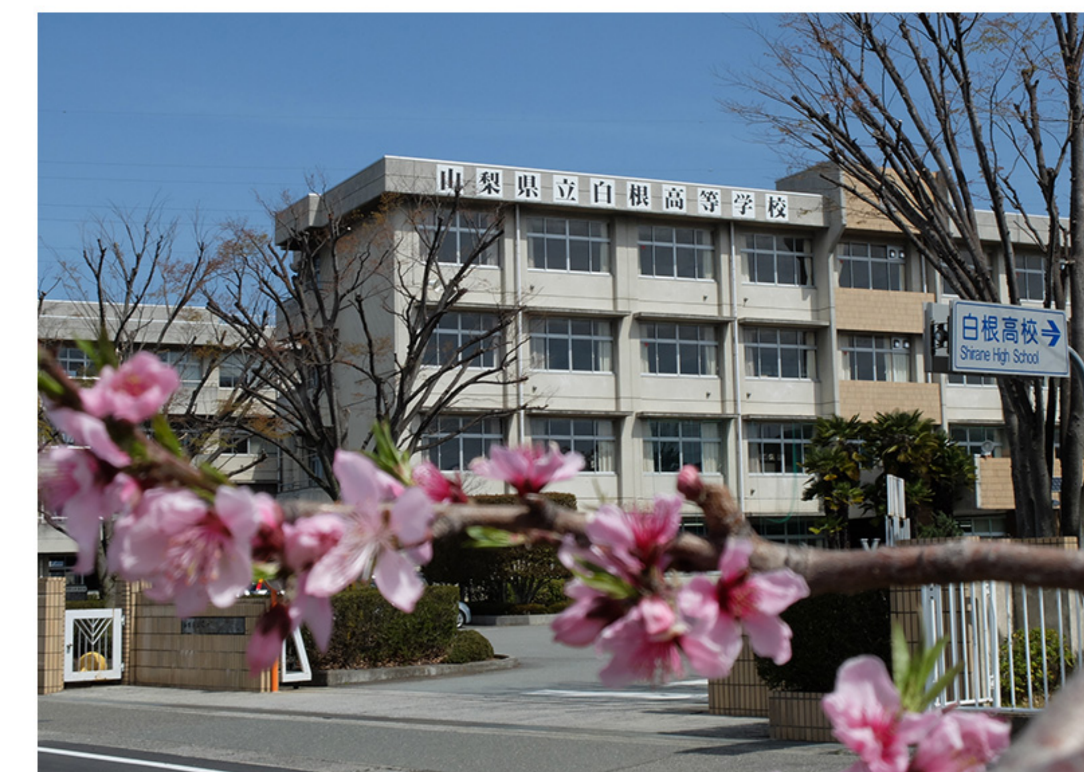
Shirane High School